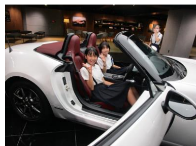
〈マツダミュージアム〉