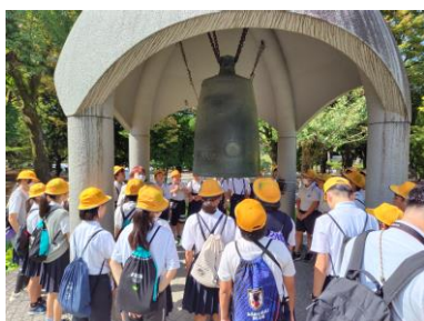
〈広島平和記念公園〉

9月12・13日に、6年生が広島方面に修学旅行に行ってきました。友達との楽しい思い出が、たくさんできたようです。